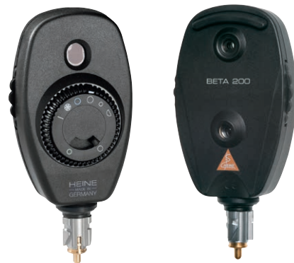
BETA 200 kuvioaukot