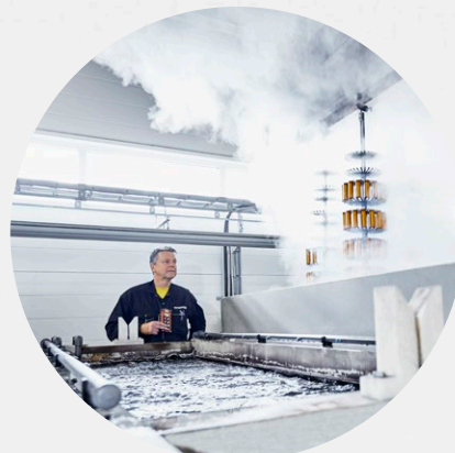
TYÖPAJAT JA TEOLLISUUSYMPÄRISTÖT