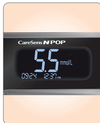
3 Resultatet syns efter 5 sekunder på den upplysta skärmen