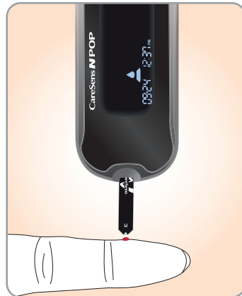
2 Lisää verinäyte