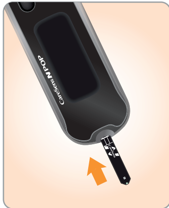
1 Aseta testiliuska