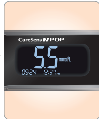
3 Tulos on luettavissa 5 sekunnissa valaistulta näytöltä